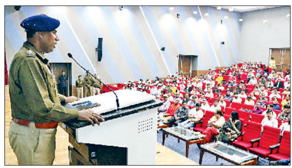
जौनवी। कार्यक्रम को संबोधित करते हुए एसपी कुलदीप सिंह।

जगह सजाए गए स्टॉल कार्यक्रम को भव्यता के और भी आकर्षक बना रहे थे। इस कार्यक्रम का मुख्य