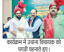
कार्यक्रम में उजाना विधायक को पागड़ी पहनाते हुए।

जौनवी। हरियाणा के डिप्टी स्पीकर डा. कृष्ण मिश्रा ने कहा कि सरकार किसानों के अधिकारों और हितों की रक्षा के लिए पूरी दृढ़ता के साथ कार्य कर रही है। किसान देश की अर्थव्यवस्था की रीढ़ हैं और यदि किसान समृद्ध होगा तो देश स्वतः समृद्धि के पथ पर अग्रसर होगा। हरियाणा के डिप्टी स्पीकर डा. कृष्ण मिश्रा बुधवार को हनेटी में प्रधानमंत्री सम्मान निधि योजना के तहत 21वीं किस्त किसानों के खतों में जारी होने के उपलक्ष्य में आयोजित जिला स्तरीय किसान सम्मान समारोह में बतौर मुख्य अतिथि कार्यक्रम को संबोधित कर रहे थे। डिप्टी स्पीकर डा. कृष्ण मिश्रा ने कहा कि मुख्यमंत्री नारायण सिंह सेनी के नेतृत्व में हरियाणा प्रदेश पहला ऐसा राज्य है, जो किसानों की 46 बागवानी फसलों का एमएसपी पर खरीदने का कार्य कर रहा है। जिला के एक लाख 31 हजार 629 किसानों के खतों में करीब 26 करोड़ 33 लाख रुपये की धन राशि बुधवार को डाली गई है। उन्होंने कहा कि अब तक किसान सम्मान निधि के तहत तीन लाख 90 हजार करोड़ रुपये डीबीटी के माध्यम से केंद्र सरकार द्वारा किसानों के खतों में भेजे गए हैं। प्रधानमंत्री किसान सम्मान निधि योजना की शुरुआत 2019 में की गई थी। तब विपक्षी नेताओं ने इसको लेकर सरकार का बहुत मजाक किया था कि केंद्र सरकार इतना पैसा कहा से लाएगी और यह योजना 2019 के चुनाव के बाद बंद हो जाएगी।