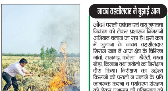
नायब तहसीलदार ने बुलाई आग