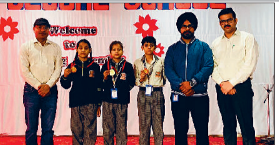
कैथल। खिलाड़ियों को सम्मानित करते एमडीएन ग्लोबल के प्रदाधिकार।