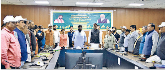
कैथल। राज्यसभा सांसद कार्तिकेय शर्मा कैथल में जिला स्तरीय कार्यक्रम में भाग लेते हुए।

राज्यसभा सांसद कार्तिकेय शर्मा ने कहा कि केंद्र व राज्य सरकार किसानों के कल्याण के लिए समर्पित है। यह सरकार सबका साथ-सबका विकास-सबका विश्वास और सबका प्रयास के मंत्र के साथ किसानों को सशक्त एवं समृद्ध बनाने की दिशा में अथक प्रयास कर रही है। इस कड़ी में देश के प्रधानमंत्री नरेंद्र मोदी ने एक बार फिर किसानों के खतों में सम्मान निधि की राशि भेजकर यह साबित कर दिया है कि किसान कल्याण इस सरकार की सर्वोच्च प्राथमिकता है। यह योजना किसानों के लिए स्थिरता और भरोसे का मजबूत सहारा बनी है। राज्यसभा सांसद कार्तिकेय शर्मा बुधवार को पीएम किसान सम्मान निधि योजना के तहत आयोजित जिला स्तरीय कार्यक्रम में बतौर मुख्य अतिथि संबोधित कर रहे थे। कार्यक्रम में प्रधानमंत्री श्री नरेंद्र मोदी ने तमिलनाडु के कोयंबटूर में