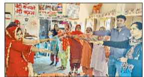
राजौद। कार्यक्रम में शपथ लेते हुए महिलाएं व आशा वर्कर।