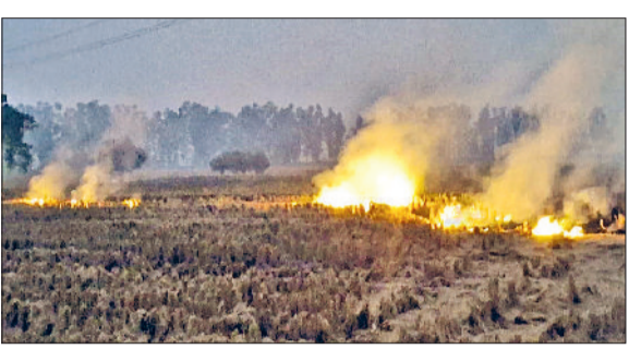
जींद। खेत में जलती हुई पराली।

अबतक पुलिस 17 धरतीपुत्रों को कर चुकी गिरफ्तार, दस जवान हो चुके सस्पेंड